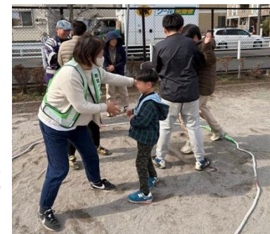
開催された イベントの 様子▶