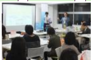
プロボノチームは事前に集まり、プロジェクトの準備を開始します。