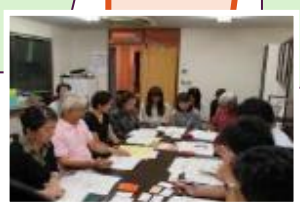
町会・自治会とプロボノチームが初対面し活動への理解を深めます。