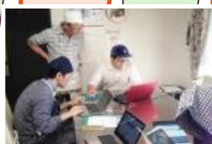
住民の皆さんへのヒアリングや成果物の作成など目標に向けてチームごとに作業を進めます。